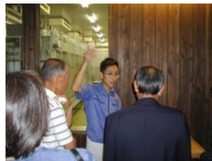
小澤酒造株式会社 酒蔵見学