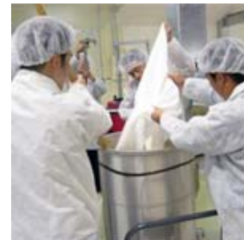
関谷醸造株式会社 酒造り体験コース